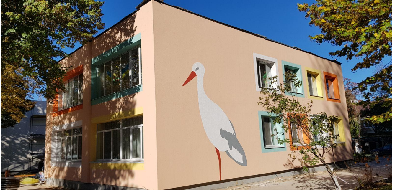
Заклад дошкільної освіти (ясла-садок) комбінованого типу № 46 Рівненської міської ради

трубопроводів, арматури, елементів теплового пункту, оздоблення приміщень та підведення комунікацій, балансування систем опалення, замість встановлених теплових вузлів відбудеться на таких об'єктах: ЗОШ №15 (нова і стара школа), ЗОШ №22, ЗОШ №25, ЗОШ №28, Музична школа №2, ДНЗ №33, Управління містобудування та архітектури.